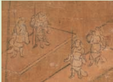
持国天 増長天 広目天 多聞天

四天王寺の本尊。世界の中心にそびえる須弥山に住み、東西南北4つの方角から世界を守護する仏教の神々。持国天、増長天、広目天、多聞天。